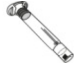
b. Spuit van 3 ml (voorgevuld met het oplosmiddel)