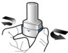
Percer et relâcher