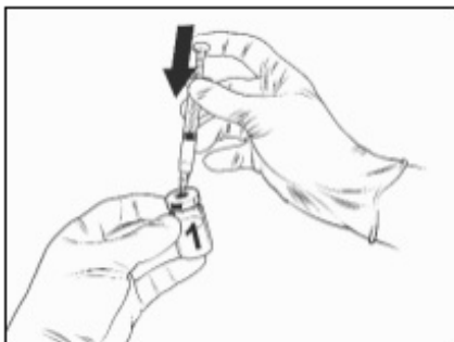
Durchstechflasche mit lyophilisiertem Impfstoff

Nehmen Sie die Durchstechflasche mit dem Impfstoff und die Fertigspritze mit dem Lösungsmittel aus dem Kühlschrank.