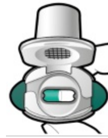
Kontrolle, ob die Kapsel entleert ist