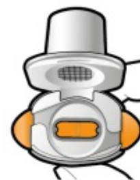
Kontrollieren Sie, ob die Kapsel entleert ist. Öffnen Sie den Inhalator, um zu sehen, ob noch Pulver in der Kapsel verblieben ist.