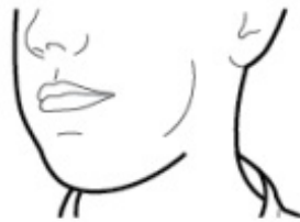
Schritt 3c: Atem anhalten Halten Sie Ihren Atem bis zu 5 Sekunden an.

Atmen Sie rasch und so tief wie Sie können ein. Während der Inhalation werden Sie ein schwirrendes Geräusch hören. Sie werden das Arzneimittel möglicherweise bei der Inhalation schmecken.