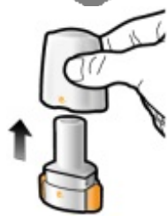
Schritt 1a: Schutzkappe abziehen