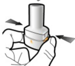
Schritt 2a: Durchstechen Sie die Kapsel einmal. Halten Sie den Inhalator nach oben. Durchstechen Sie die Kapsel, indem Sie beide Seitentasten gleichzeitig fest drücken.