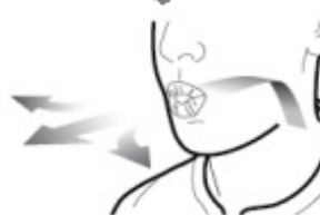
Schritt 3a: Atmen Sie vollständig aus. Blasen Sie nicht in den Inhalator.