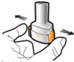
Schritt 2b: Lassen Sie die Seitentasten los.

Wenn die Kapsel durchstochen wird, sollten Sie ein Klicken hören. Durchstechen Sie die Kapsel nur einmal.