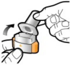
Schritt 1b: Inhalator öffnen