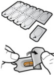
Schritt 1c: Kapsel entnehmen Trennen Sie eine Blisterzelle von der Blisterpackung ab. Öffnen Sie die Blisterzelle durch Abziehen der Folie und entnehmen Sie die Kapsel. Drücken Sie die Kapsel nicht durch die Folie. Sie dürfen die Kapsel nicht schlucken.