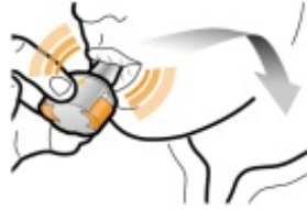
Schritt 3b: Das Arzneimittel tief inhalieren Halten Sie den Inhalator wie im Bild gezeigt. Nehmen Sie das Mundstück in den Mund und schließen Sie die Lippen fest darum. Drücken Sie nicht auf die Seitentasten.

Atmen Sie rasch und so tief wie Sie können ein. Während der Inhalation werden Sie ein schwirrendes Geräusch hören. Sie werden das Arzneimittel möglicherweise bei der Inhalation schmecken.