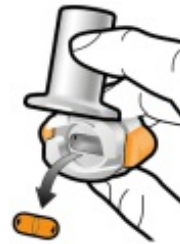
Entleerte Kapsel entfernen Entsorgen Sie die entleerte Kapsel in den Haushaltsabfall. Schließen Sie den Inhalator und setzen Sie die Schutzkappe wieder auf.