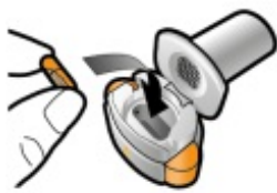
Schritt 1d: Kapsel einlegen Legen Sie niemals eine Kapsel direkt in das Mundstück.

Wenn die Kapsel durchstochen wird, sollten Sie ein Klicken hören. Durchstechen Sie die Kapsel nur einmal.